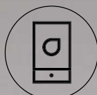
Bedienung im Fernmodus