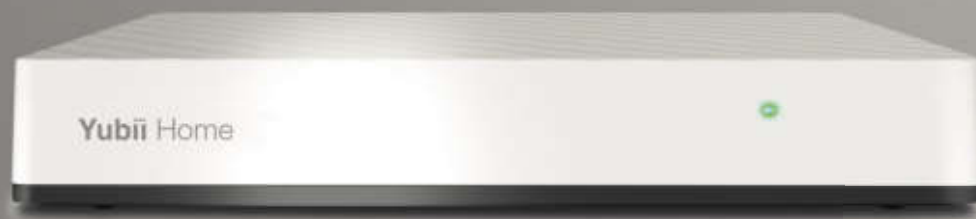
Yubii Home Gateway