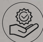
Stabilität und Zuverlässigkeit